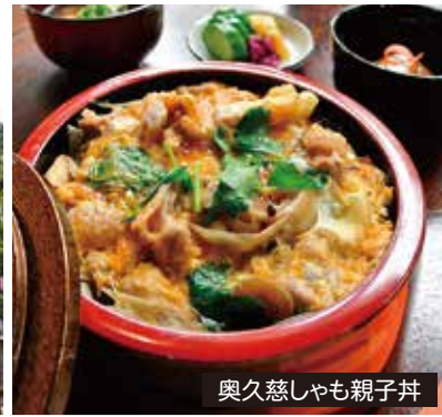
奥久慈しゃも親子丼