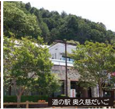
道の駅 奥久慈だいが