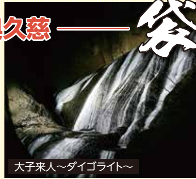
大子来人〜ダイゴライト〜