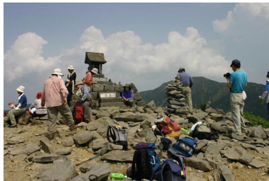
根子岳頂上 イメージ

行程: 勝田ー水戸ー鯉淵(5:40頃)ー菅平牧場(10:00頃) …峰の原…根子岳(2207m)…菅平牧場(14:30頃) ー入浴ー鯉淵(19:55頃)ー水戸ー勝田