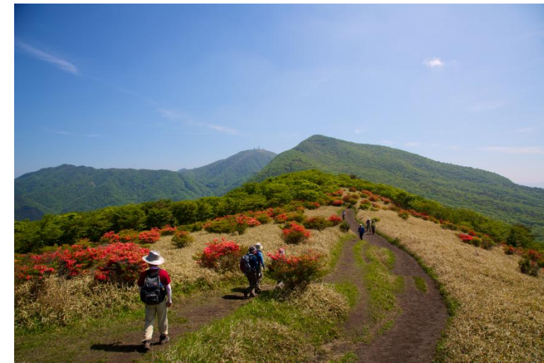
荒山高原から鍋割山へ イメージ

行程: 勝田ー水戸ー鯉淵(6:15頃)ー姫百合駐車場(9:00頃)…荒山高原…荒山(1571m)…荒山高原 …鍋割山(1332m)…荒山高原…姫百合駐車場(14:30頃)ー入浴ー鯉淵(18:45頃)ー水戸ー 勝田