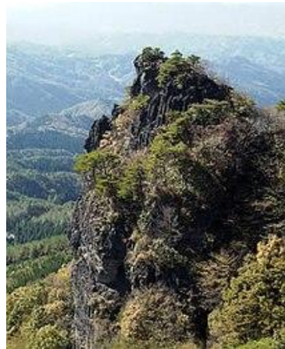
見下し岩から見た霊山の岩山 イメージ

行程: 鯉淵ー水戸ー勝田(6:00頃)ーこどもの村登山口 (10:00頃)…見下し岩…護摩壇…西物見岩… 東物見岩(825m)…蟻の戸渡り…見下し岩… こどもの村登山口(14:00頃)ー入浴ー勝田 (18:55頃)ー水戸ー鯉淵