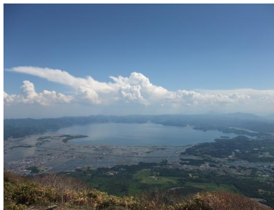
磐梯山山頂から望む猪苗代湖 イメージ

行程: 鯉淵ー水戸ー勝田(6:00頃)ー八方台登山口(10:00頃) …中の湯跡…弘法清水…磐梯山(1816m)…小金清水 …火口原…裏磐梯スキー場(15:45頃)ー入浴ー勝田 (20:45頃)ー水戸ー鯉淵