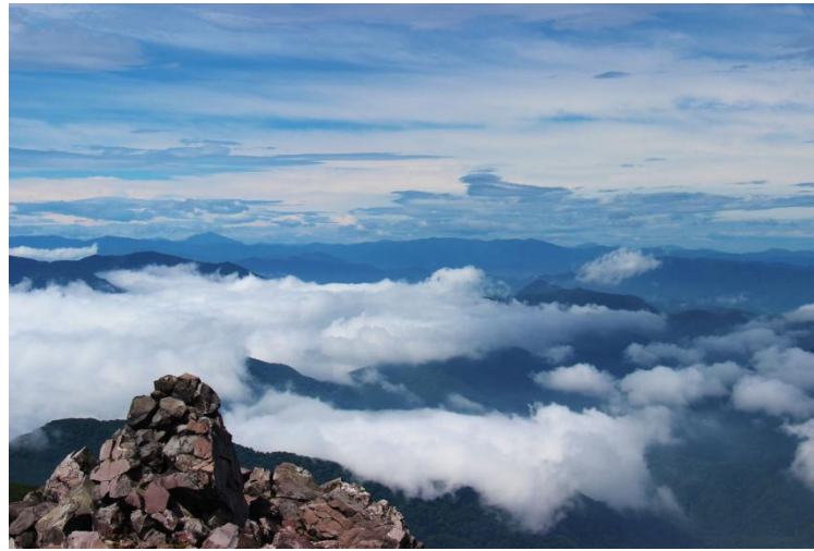
茶臼岳頂上 イメージ

行程: 勝田ー水戸ー鯉淵(6:15頃)ー 那須ロープウェイ山麓駅ー山頂駅(9:30頃) …茶臼岳(1898m)…南月山(1776m) …峰の茶屋跡…峠の茶屋駐車場(14:45頃) ー入浴ー鯉淵(18:40頃)ー水戸ー勝田