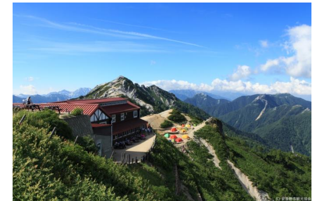
燕山荘と燕岳 イメージ

行程: ①②勝田-水戸-鯉淵(23:40頃)-中房温泉 (6:00頃)...合戦小屋...燕山荘... 燕岳(2763m)...燕山荘(12:30頃 泊) ③燕山荘(6:00)...大天荘...大天井岳(2922m) ...大天荘...常念小屋(14:15頃 泊) ④常念小屋(6:00)...常念岳(2857m)...前常念岳 ...三股登山口(14:30頃)-入浴-鯉淵(21:15頃) -水戸-勝田