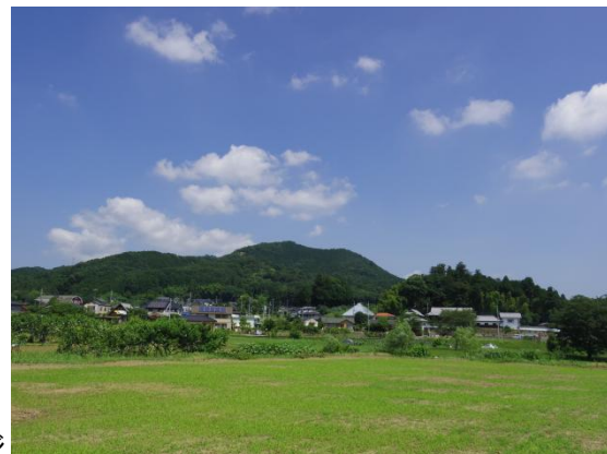
日和田山遠景 イメージ

行程: 勝田ー水戸ー鯉淵(6:10頃)ー東吾野駅(9:10頃)・・・ユガテ・・・ヤセオネ峠・・・日和田山(305m)・・・巾着田(13:30頃 見学)ー入浴ー鯉淵(17:50頃)ー水戸ー勝田