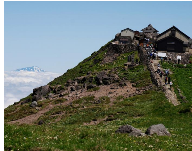
月山頂上と雲海奥の鳥海山 イメージ

行程: ①鯉淵-水戸-勝田(4:40頃)-仙人沢(10:30頃) ...湯殿山神社...装束場...牛首...月山(1980m) ...月山頂上小屋(15:30頃 泊) ②月山頂上小屋(7:00)...二の岳...弥陀ヶ原 (10:00頃)-羽黒山頂駐車場(12:40頃)... 出羽三山神社...羽黒山登山口(13:45頃)-入浴- 勝田(21:00頃)-水戸-鯉淵