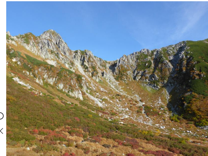
千畳敷カールと宝剣岳 イメージ