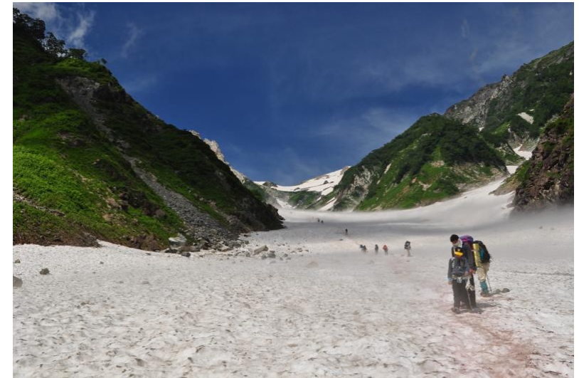
白馬大雪渓 イメージ

行程: ①②勝田-水戸-鯉淵(23:30頃)- 白馬八方バスターミナル(現地バス乗換) -猿倉(6:30頃)...大雪渓...白馬山荘 (14:30頃 泊) ③白馬山荘(6:00)...白馬岳(2932m) ...白馬大池...梅池自然園(13:30頃) =ロープウェイ=梅池高原-入浴-鯉淵 (21:20頃)-水戸-勝田